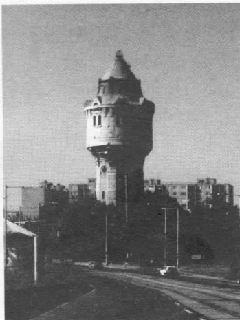
IV. KER., ÁRPÁD ÚT

A radikális feministák a hetvenes években két részre szakadtak abban a tekintetben, hogy a férfiakat úgymond szövetségesnek vagy ellenfélnek tekintik a szerepek átértékelésének folyamatában. Az egyik irányzat azt vallotta, hogy a nők a férfakkal mindenben azonos szerepet tudnak vállalni, és ezért a nemek közötti szerepkülönbséget a minimálisra lehet csökkenteni. Ebben az új szerepdefinícióban a férfiaknak aktív szerepet kell biztosítani, így kívánták elérni az osztársadalmi konszenzust. A radikálisabb irány viszont azt hangoztatta, hogy a nőknek nem lehet célja a férfakkal folytatott versengés, hanem a női létforma másságának és egyenlőségének elfogadásáért kell harcolni. Az olyan hírhedt radikális feministák, mint Cathrine MacKinnon vagy a nemrég elhunyt Andrea Dworkin tollából nem ritkán születtek igen meglepő, a józan ész számára már-már felfoghatatlannak tűnő állítások. A heteroszexualitást erőszaknak tartották, s úgy vélték, hogy a nők csak azért élvezik a szexet, mert arra szocializálták őket, és igazából a szex a dominancia-viszonyok egyik manifesztációja. (És amikor a nő van felül...?) Az anyaságot igen gyakran állították